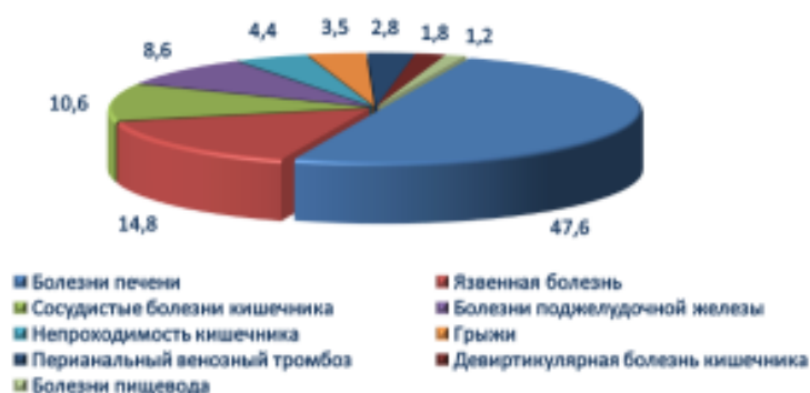
Структура причин смертности от болезней пищеварения

Болезни печени в структуре смертности от болезней органов пищеварения составляют 47,6% и напрямую связаны с социальными факторами, в том числе злоупотреблением алкоголем. Среди всех болезней печени наибольшая доля приходится на фиброзы и циррозы – 93,8%